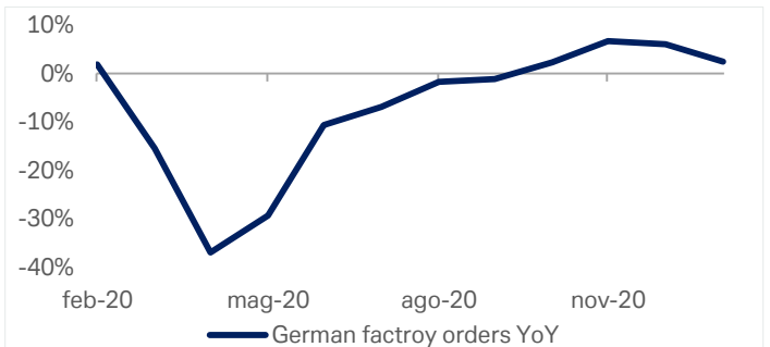
Grafico 2: Ordinativi alle fabbriche tedesche